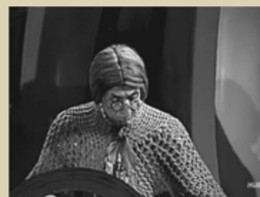
A Velha e o Filiz

Baseado na antiga canção popular brasileira, o curta ilustra, com humor e ritmo crescente, o cotidiano de uma fazenda de interior. A partir da velha que faz em sua roça, uma sequência de acontecimentos encadeados transforma a tranquila rotina.